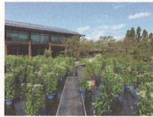
「水鏡」にて展示されたフジバカマ

また、KESエコロジカルネットワーク参加243事業所を一覧にしたパネルを会場に展示し、参加事業所をご紹介します。