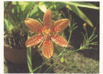
開花したヒオウギ