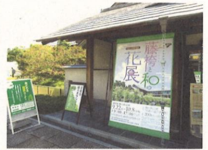
藤袴と和の花展の様子

9月22日から10月8日まで、第10回「藤袴と和の花展」が梅小路公園で開催されました。同展は、フジバカマや他の希少な植物の保全の大切さを訴える中で、保全に取り組む団体の活動紹介を行っています。