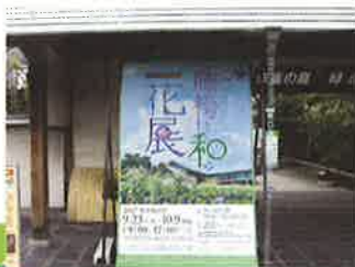
今年も藤袴と和の花展が開催されています

秋の七草のひとつに数えられるフジバカマはキク科の多年草。夏の終わりから秋のはじめにかけて、淡い薄紅色の花を咲かせます。9月海外に渡る蝶、アサギマダラが蜜を好み訪れることもあります。茎や葉は乾燥させると桜餅に似た香りがし、香料にも利用されます。京都レッドリスト（2015）で絶滅寸前種に分類されています。