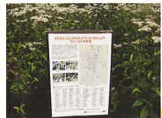
KESエコロジカルネットワークでの育成の取り組みをパネルで紹介しています