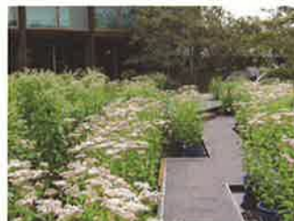
「水鏡」で展示されるフジバカマ