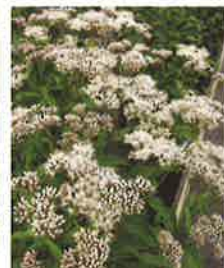
優しい色をした花が咲きます