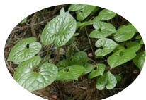
葵祭で使われるフタハアオイ